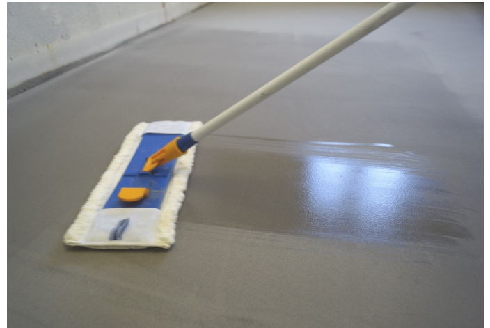
Tragen Sie dann den Premium-Lack auf dem noch nassen Boden mit kreisenden Bewegungen auf.