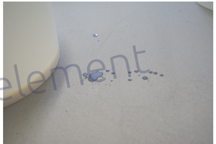
Achten Sie auf Lacktropfen, weil die Marken bleiben werden.