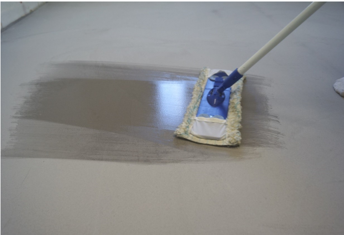
Befeuchten Sie den Boden mit einem Mikrofasermopp oder einem nassen Mopp.